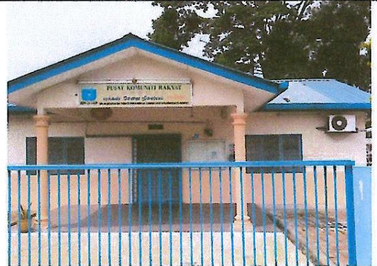
Balai Masyarakat Sg. Besi Indah