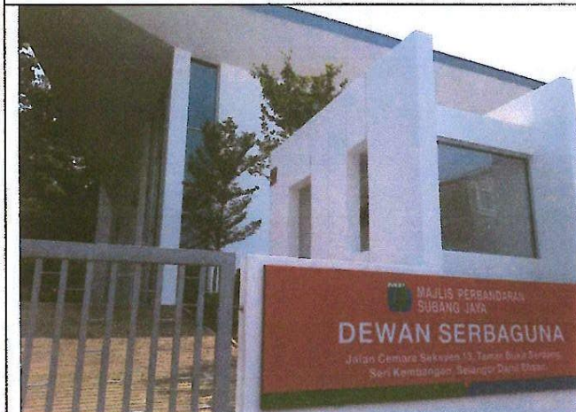
Dewan Serbaguna Bukit Serdang Seksyen 11