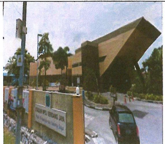
Stadium Tertutup Serdang Jaya