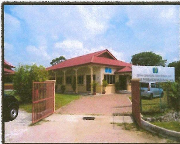
BalaiMasyarakatKembang Sari 2, Sri Serdang