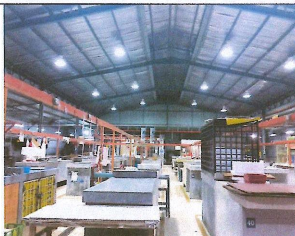
Pasar Basah SK 6/1 Seri Kembangan