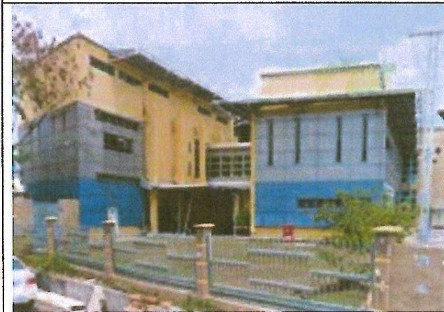
Kompleks 3K Serdang Raya