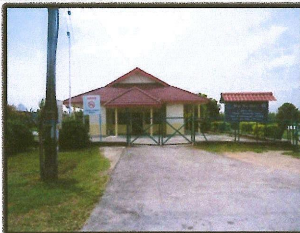
BalaiMasyarakat PKNS, Jln 2/1, Serdang Jaya