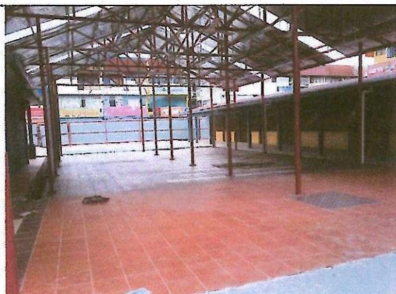
Medan Selera Sri Serdang