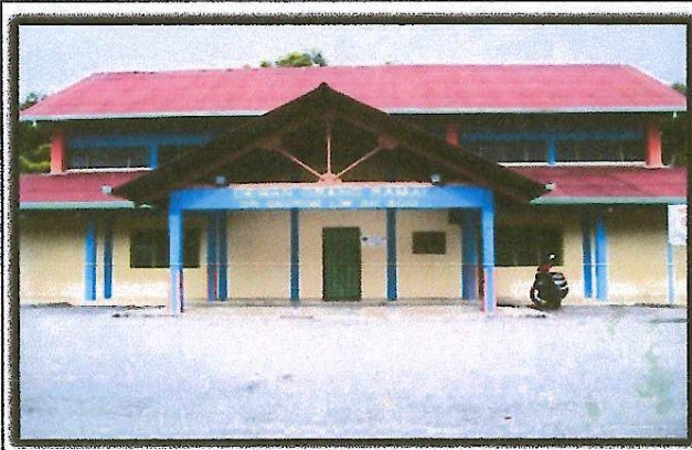
Dewan Serbaguna Dr.George Tmn Equine