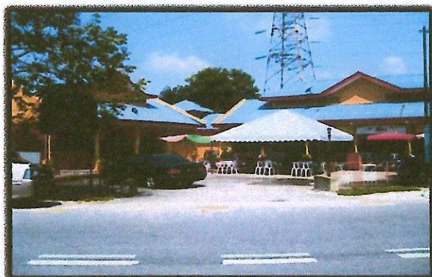
Medan SeleraJalan Raya 6, Serdang Jaya