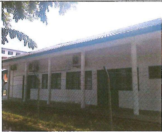
Balai Masyarakat Tmn Muhibbah