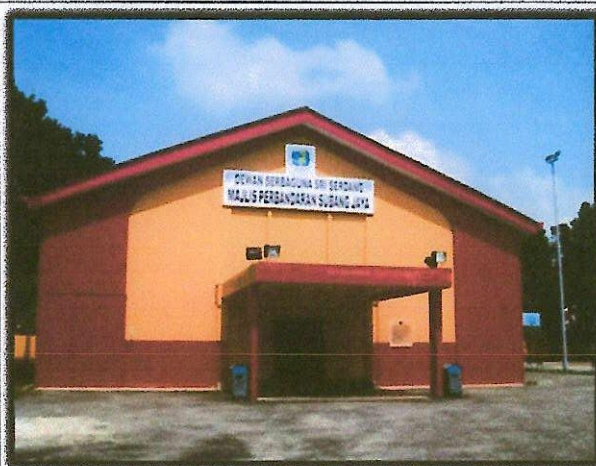
DewanSerbaguna Sri Serdang